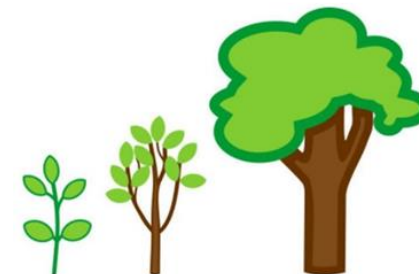
'Van kleine spriet naar sterke boom'

Leer ons leven, Leer ons groeien, Leer ons als een bloem te bloeien. Leer ons elke dag voortaan enkel in uw zon te staan.